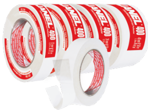
Cinta Doble Cara